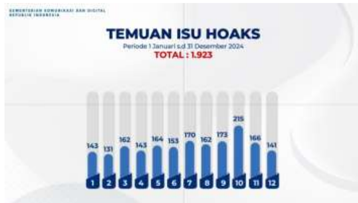
Gambar 1. Data Temuan Isu Hoaks Sepanjang Tahun 2024

memiliki integritas moral dan etika, khususnya dalam penggunaan teknologi informasi. Pendidikan Agama Islam (PAI), sebagai salah satu unsur penting dalam sistem pendidikan nasional, memiliki peran strategis dalam membentuk karakter dan etika digital mahasiswa (Arifuddin, Yosi, dan Marlina 2024).